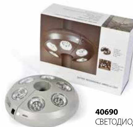
40690 СВЕТОДИОДНАЯ ЛАМПА

Размер – 300x300 см. Алюминиевая структура Гибкие спицы - 8 шт. Боковая стойка, вращение 360°, наклон Максимальная скорость ветра: 29-38 км/час. Основание – 80x80x5 см гранит BLACK с 4-мя вмонтированными колёсами 100 кг.